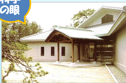
葉山しおさい博物館

昭和発祥の地。昭和天皇御採集の 海洋生物御下賜標本の他、葉山の 海洋生物をわかりやすく紹介。