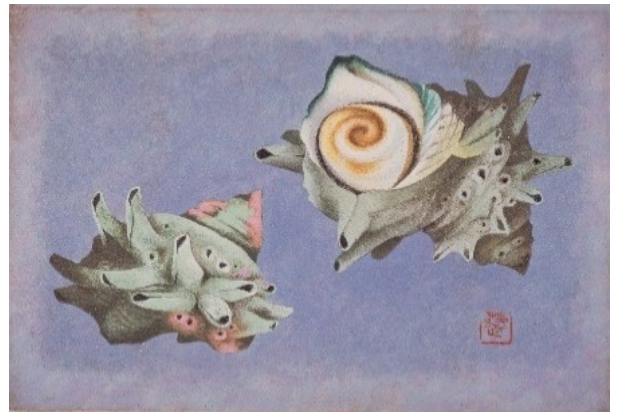
山口蓬春《さざえ》 切手原画 昭和42年(1967) 郵政博物館蔵