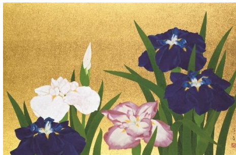
山口蓬春《花菖蒲》昭和37年 山口蓬春記念館蔵