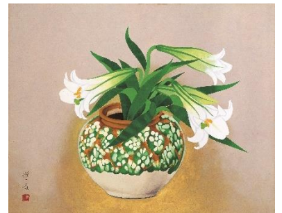
山口蓬春《百合》昭和32年 山口蓬春記念館蔵