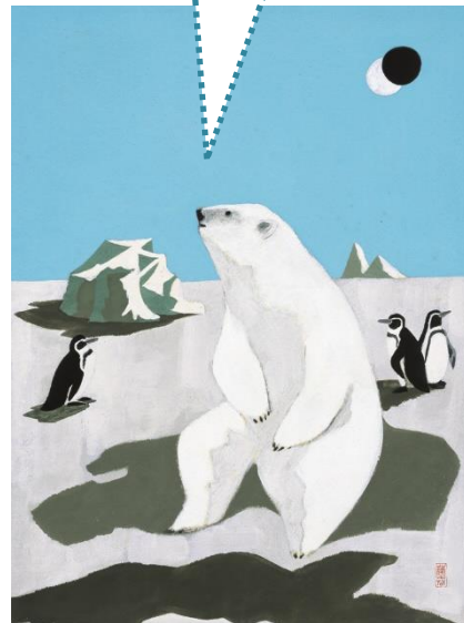
山口蓬春《望郷 小下絵》昭和28年 山口蓬春記念館蔵