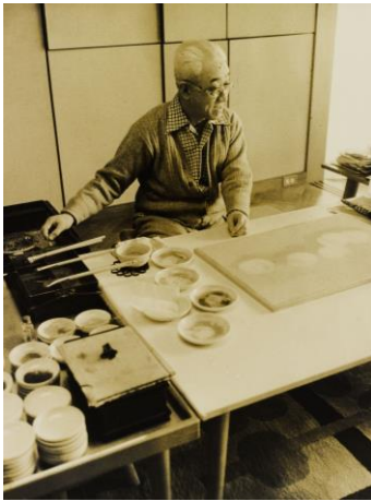
画室で制作する蓬春

山口蓬春(1893-1971)は、東京美術学校(現・東京藝術大学)日本画科に学びました。古典による伝統的な日本画を探求する一方で、西洋画の技法を取り入れる等、従来にない数々の試みを実践し、独自の新日本画の世界を築きました。日本画の進展に大いに貢献した蓬春は、昭和40年には文化勲章を受章、数々の業績を残しています。