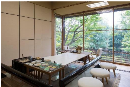
画室(吉田五十八氏設計)昭和28年

山を背にして葉山の海をのぞむ風光明媚な場所に立地する当館では、蓬春の作品やコレクションを展示するほか、著名な建築家である吉田五十八氏設計のアトリエ、四季の趣豊かな庭園を公開しております。来館された方には、蓬春の生前の創作活動に想いを馳せていただくとともに、葉山の自然を満喫していただけます。