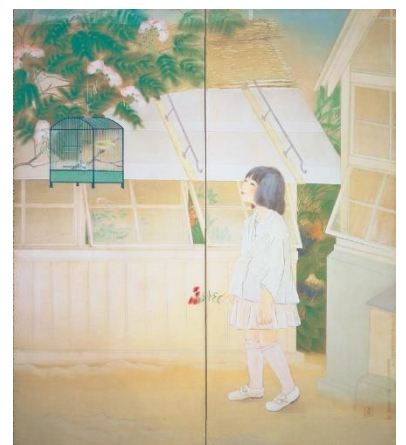
山口蓬春《初夏の頃(佐保村の夏)》 大正13年 山口蓬春記念館蔵